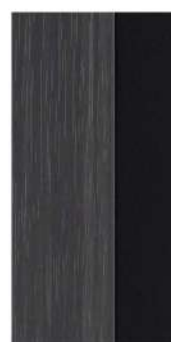
Noir / Dark