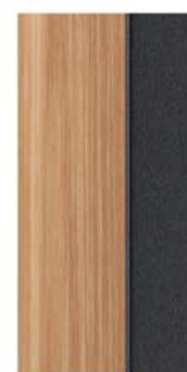
Chêne clair Light Oak