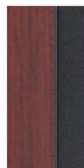
Rouge / Red